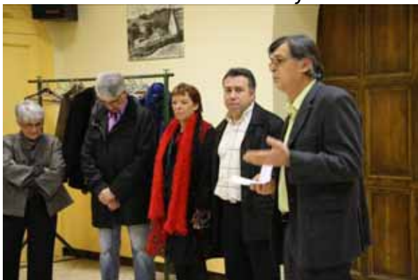
8 janvier 2010 : vœux aux associations