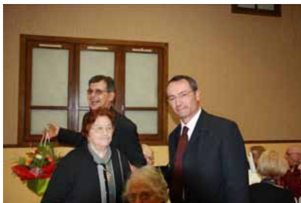
23 janvier 2010 : repas des anciens