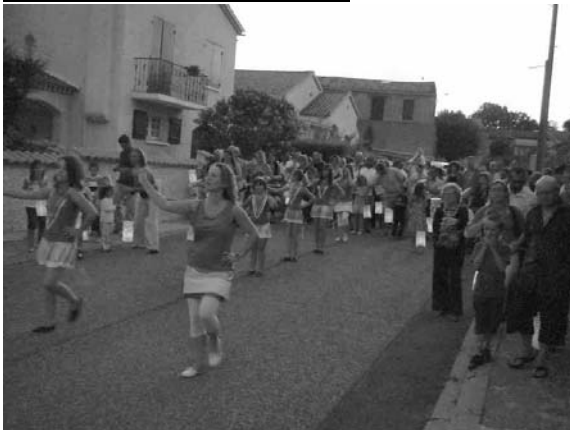
Majorettes et retraite aux flambeaux